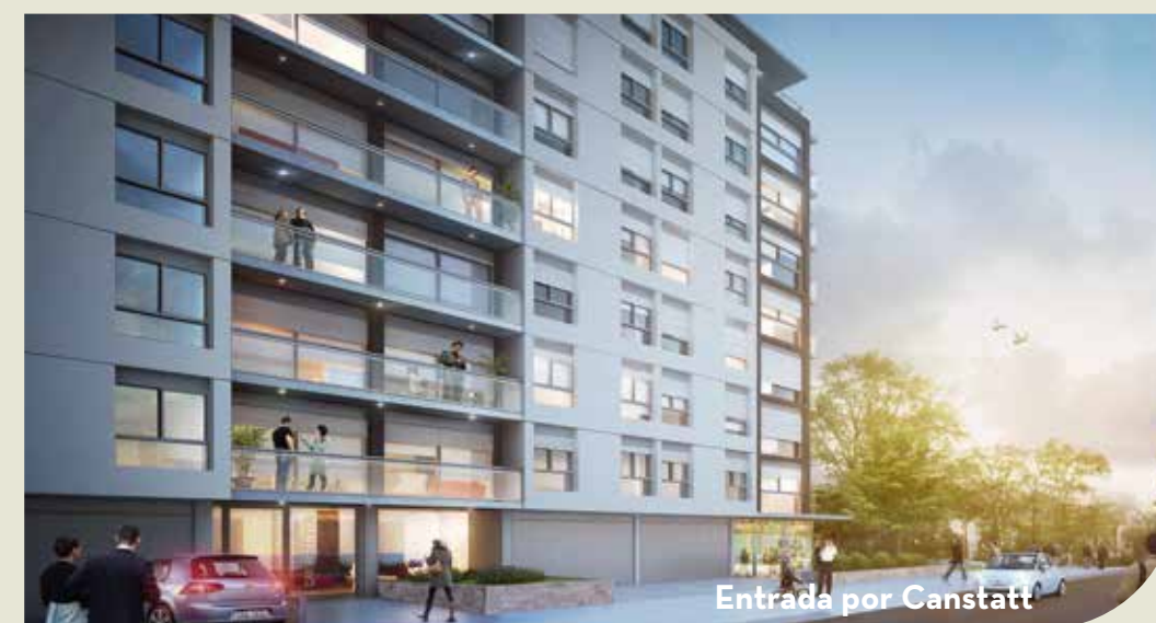
Entrada por Canstätt