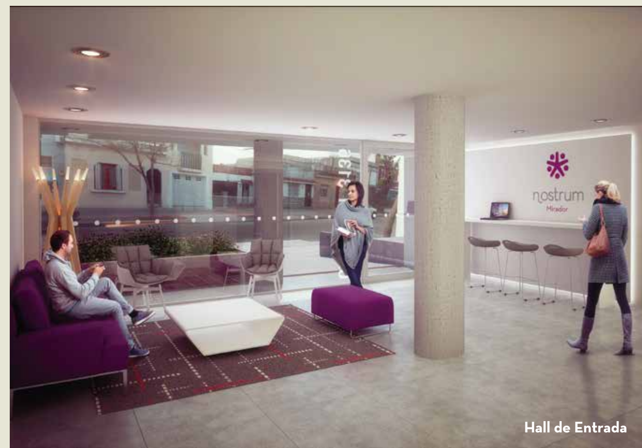
Hall de Entrada