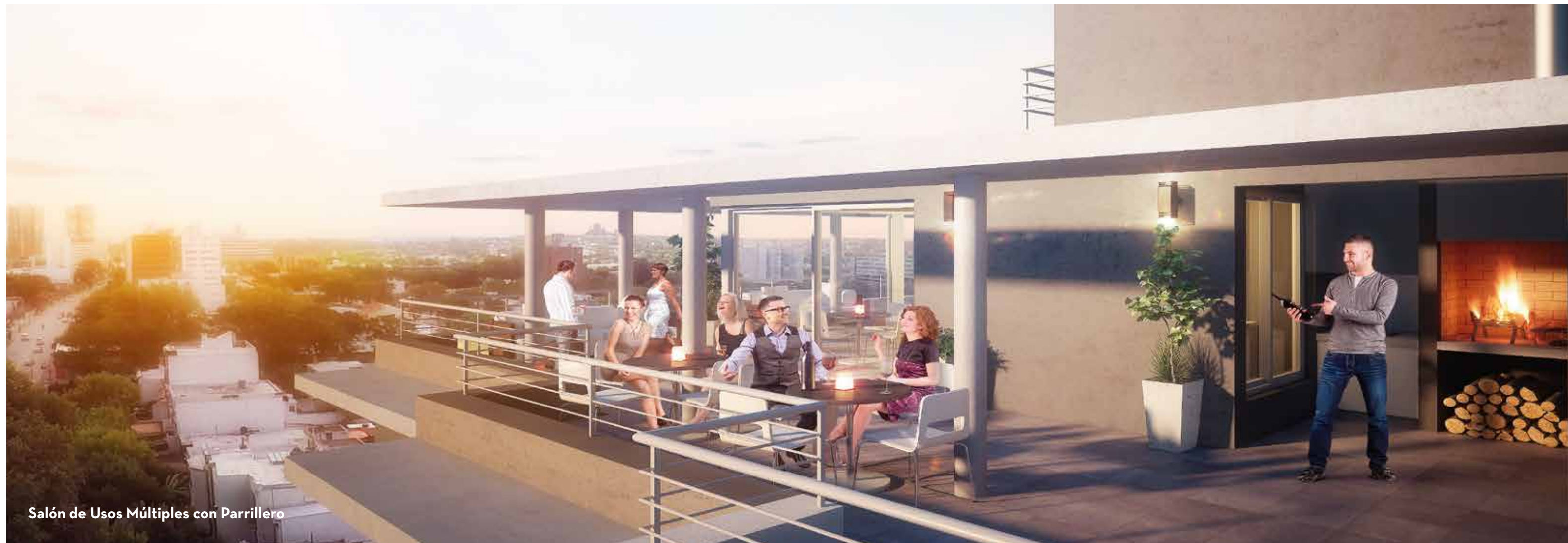
Salón de Usos Múltiples con Parrillero