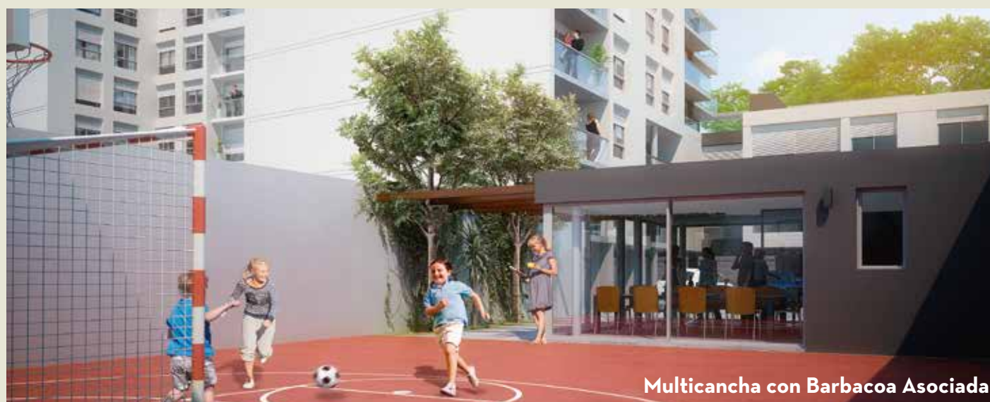
Multicancha con Barbacoa Asociada