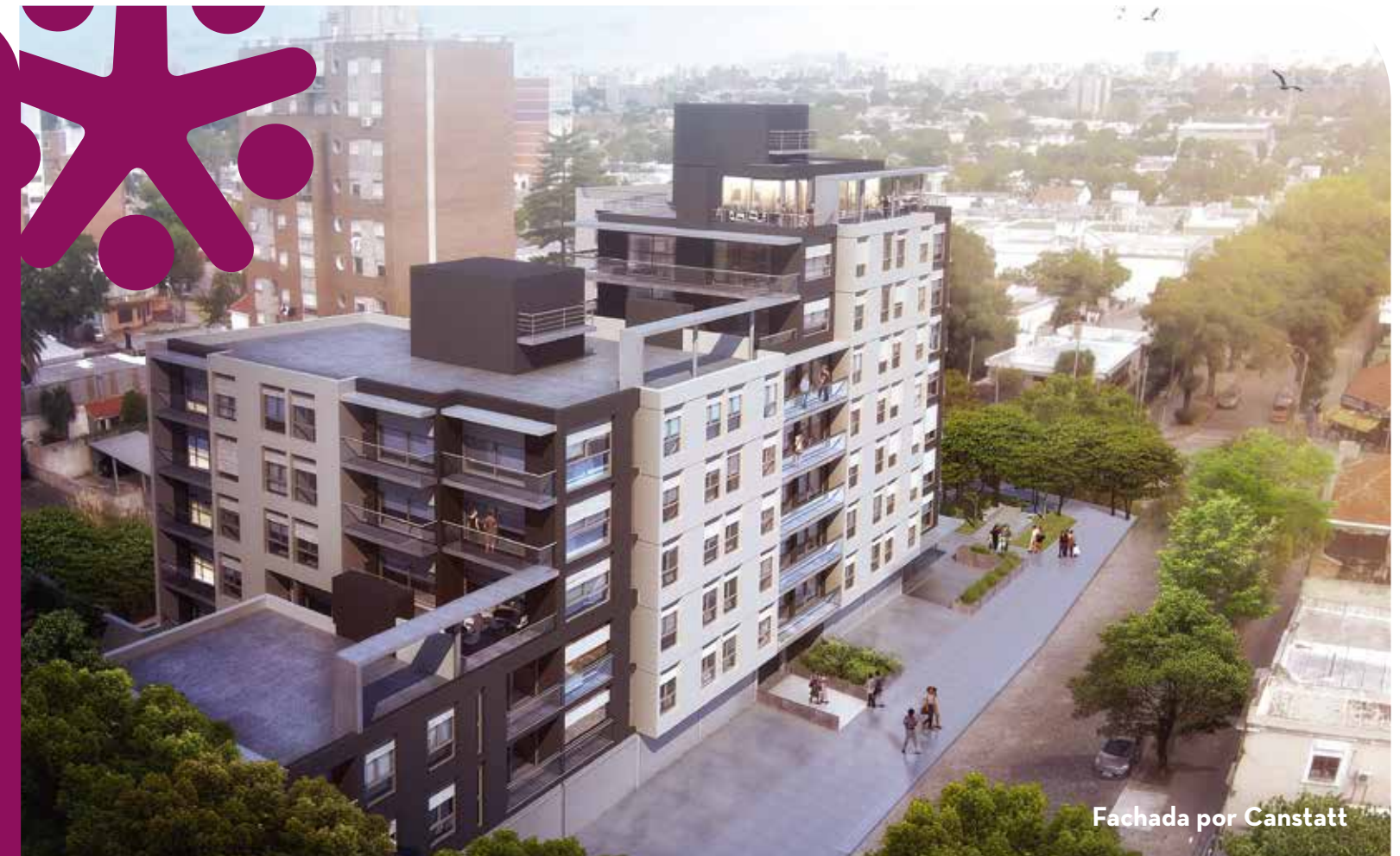
Fachada por Canstatt