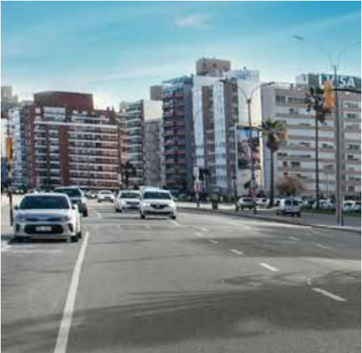
CONECTADO CON LAS AVENIDAS PRINCIPALES