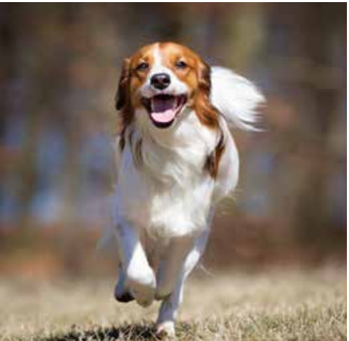
ESPACIOS ABIERTOS, AMIGABLES CON LAS MASCOTAS