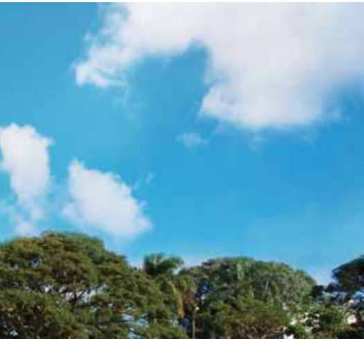
ENTORNO VERDE Y ARBOLADO.