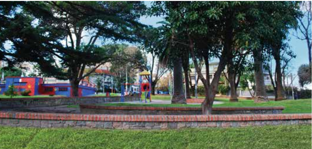
PLAZAS Y ESPACIOS VERDES